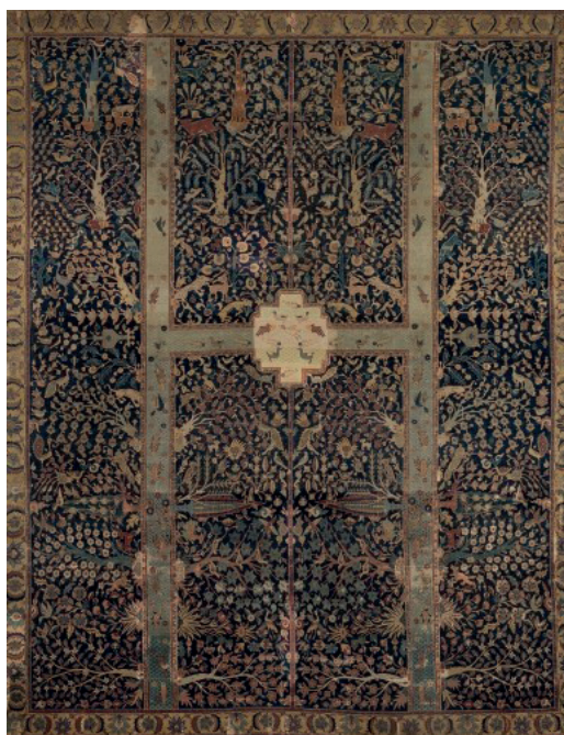
Рисунок 1. Древнеперсидский ковер изображения сада «Парадиз» Сасанидского Ирана III-IV вв.

Привлекает внимание и достойна рассмотрения ковровая миниатюра древнеперсидского сада «Парадиз» эпохи Сасанидского Ирана III-IV в. н. э. Рисуночный ассортимент зелени в саду имеет сходство с такими деревьями, как стройные кипарисы, высокоствольные чинары, плакучие ивы, восточные айланты, тополя, придающий вид живой зеленой ограды фруктовые деревья и вьющиеся низкорослые красивоцветущие растения (рис.1).