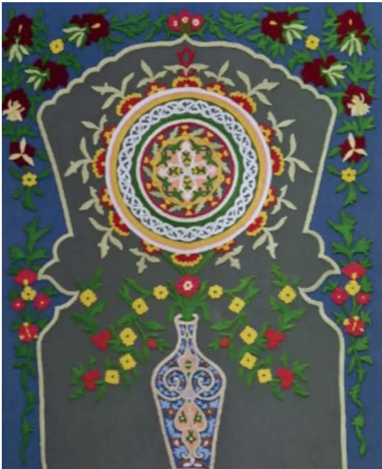
Адрасу қолинбофӣ дар Қалъаи Хучанд