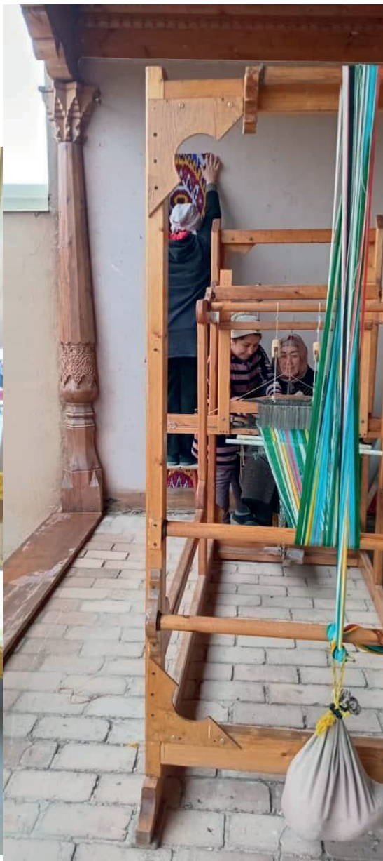
Адрасу қолинбофӣ дар Қалъаи Хучанд