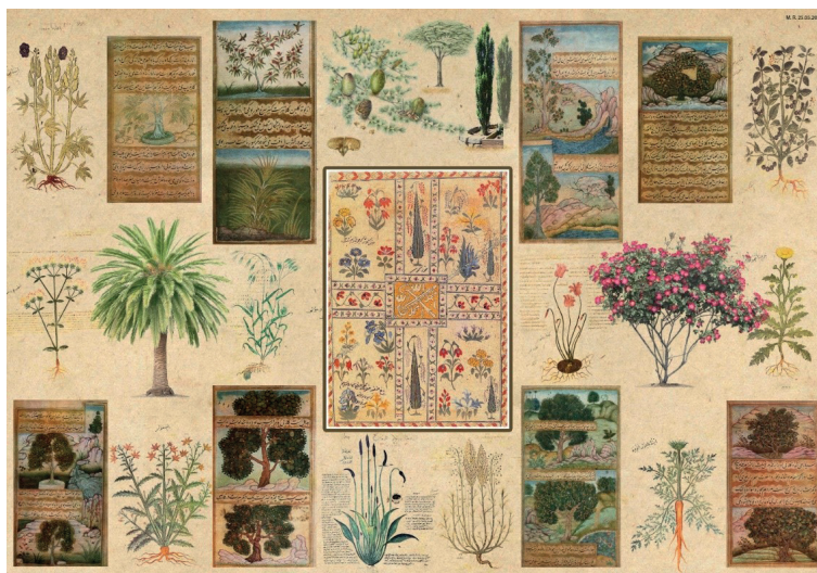
Рисунок 2. Коллаж растительности использовавших в исторических садах «Чор-бог» и растений, имеющие место в нём, согласно средневековым миниатюрам и трактатам.

В Бабуридских садах переплелись две ветви символов паркового искусства Индуизма и ислама: плодовые, тисовые, вечнозеленые, вертикальные деревья, а также большая любовь к природе, животным, птицам. А чинара Азиатской почиталась необыкновенной. [12, с.5].